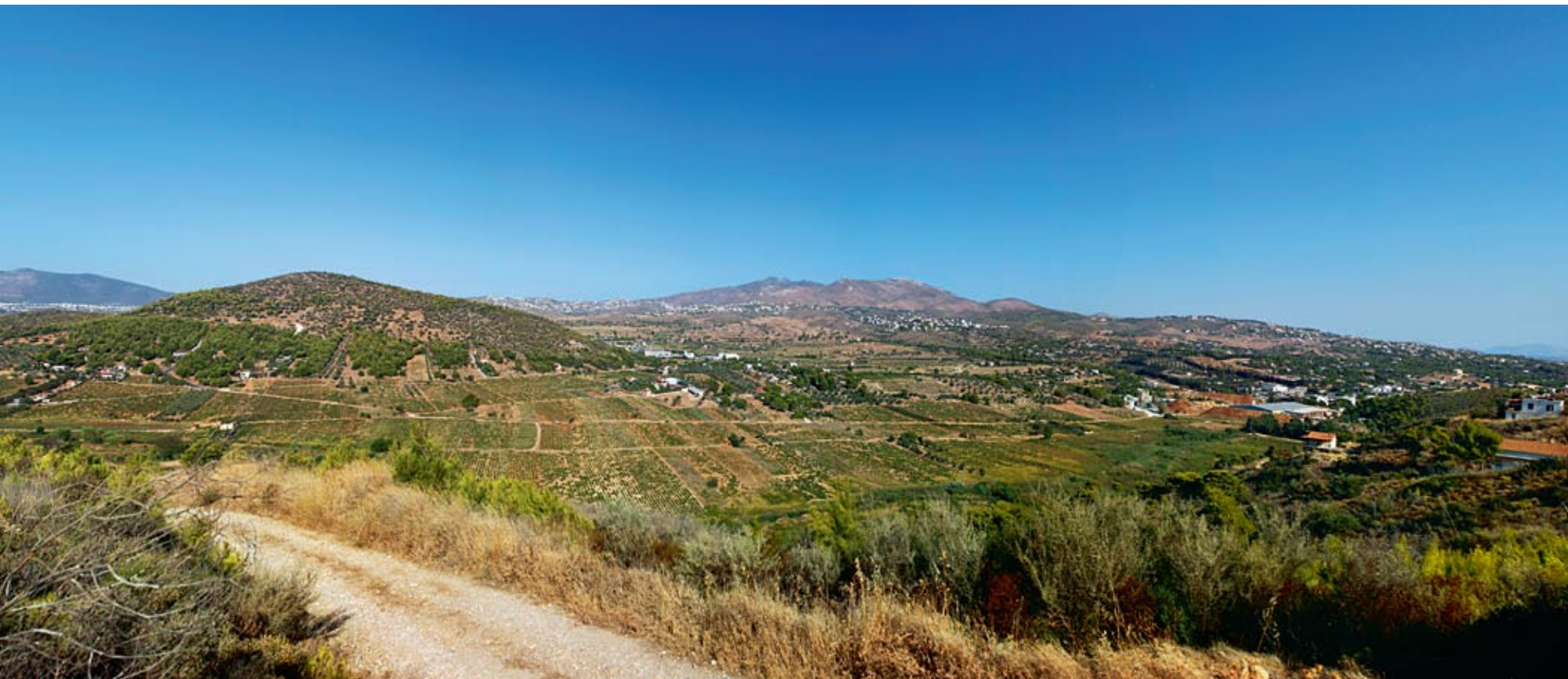
Η τοποθεσία «Πλατύ Χωράφι», όπου προβλέπεται να κατασκευαστεί το Κέντρο Επεξεργασίας Λυμάτων.

Αλλά και ο Κώστας Τριάντης, ειδικός γραμματέας Υδάτων του ΥΠΕΚΑ, εξηγεί πως δεν υπάρχει αντιπρόταση, υπενθυμίζοντας πως είχε δοθεί αρκετός χρόνος στους δήμους προκειμένου να κάνουν τις δικές τους διερευνήσεις: «Το Πλατύ Χωράφι είναι η μοναδική έτοιμη προς υλοποίηση πρόταση. Δεν υπάρχει άλλη ώριμη πρόταση, υπάρχουν μόνο εκθέσεις ιδεών. Όλα αυτά που λένε δεν καταγράφονται και δεν υποστηρίζονται με έναν τεχνικό τρόπο, ούτε καν με μια προμελέτη. Και το κόστος της προμελέτης δεν είναι απαγορευτικό...». Επισημαίνει δε ότι, ενώ υπάρχουν διαθέσιμα κονδύλια για τη χρηματοδότηση τέτοιων έργων, δεν γίνεται τίποτα λόγω της έλλειψης σχεδιασμού.