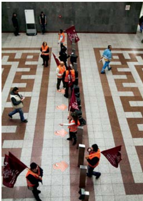
Μέλη του κινήματος «Δεν πληρώνω» έχουν καλύψει με μαύρες σακούλες τα ακυρωτικά μηχανήματα στο σταθμό του Συντάγματος, στη διάρκεια των κινητοποιήσεων τον περασμένο Μάρτιο.