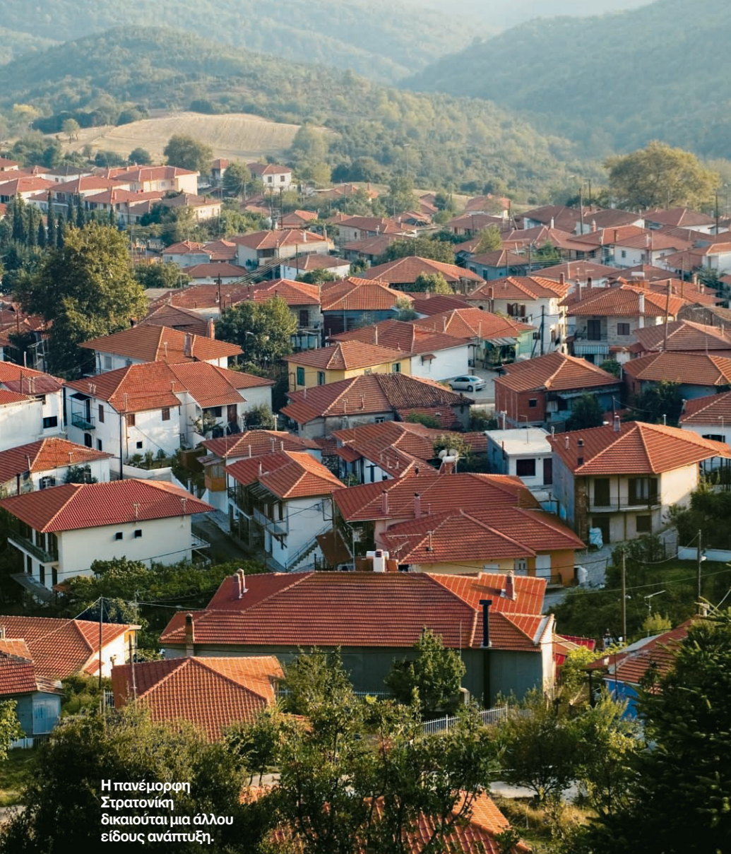
Η πανέμορφη Στρατονίκη δικαιούται μια άλλου είδους ανάπτυξη.