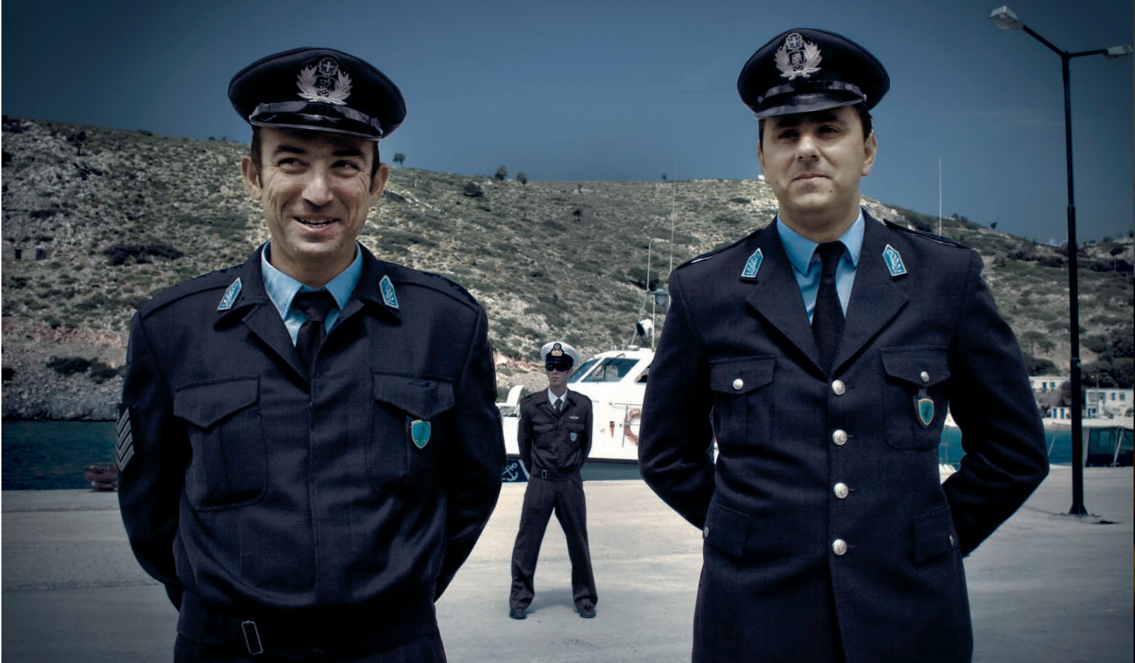
Αστυνομικοί, λιμενικοί και κάτοικοι αδυνατούν να κατανοήσουν την επίσημη πολιτική γραμμή.

Π υθαγόρειο Σάμου - Αγαθονήσι σε περίπου μία ώρα με το «Νήσος Κάλυμνος». Μαζί μας αποβιβάζονται ένας μόνιμος υπαξιωματικός και δυο-τρεις φαντάροι, που υπηρετούν στο υπερούχρονο φυλάκιο πάνω στο Κάστρο. Κατασκευάστηκε πρόσφατα στην κορυφή της ανατολικής πλευράς του νησιού για την απόπειρα της θαλάσσιας περιοχής μέχρι τα απέναντι τουρκικά παράλια, την αρχαία Μίλητο, όπου εκβάλλει ο Μαϊάνδρος ποταμός, νοτίως του Κουσάντασι, απ' όπου σχεδόν καθημερινά εισβάλλουν λάθρα με φουσκωτά σκάφη οικονομικοί μετανάστες. Το φαινόμενο έχει πολλαπλασιαστεί τα τελευταία δύο χρόνια και μόνο πέρυσι έφτασαν στο Αγαθονήσι περίπου 5.000 άτομα, ενώ φέτος μέχρι το Μάιο περίπου 1.500. Το διεθνές δουλεμπορικό κύκλω-