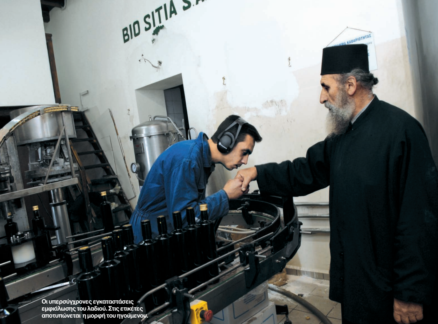
Οι υπερσύγχρονες εγκαταστάσεις εμφιάλωσης του λαδιού. Στις ετικέτες αποτυπώνεται η μορφή του ηγούμενου.