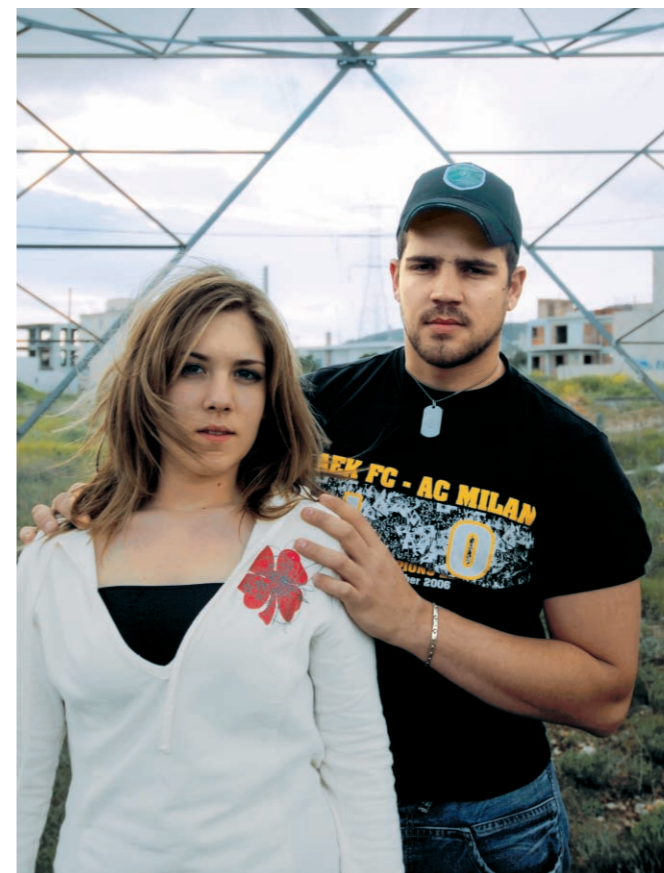
Πολλοί κάτοικοι ζουν σε σπίτια κάτω από τους (επικίνδυνους για την υγεία) πυλώνες της ΔΕΗ...