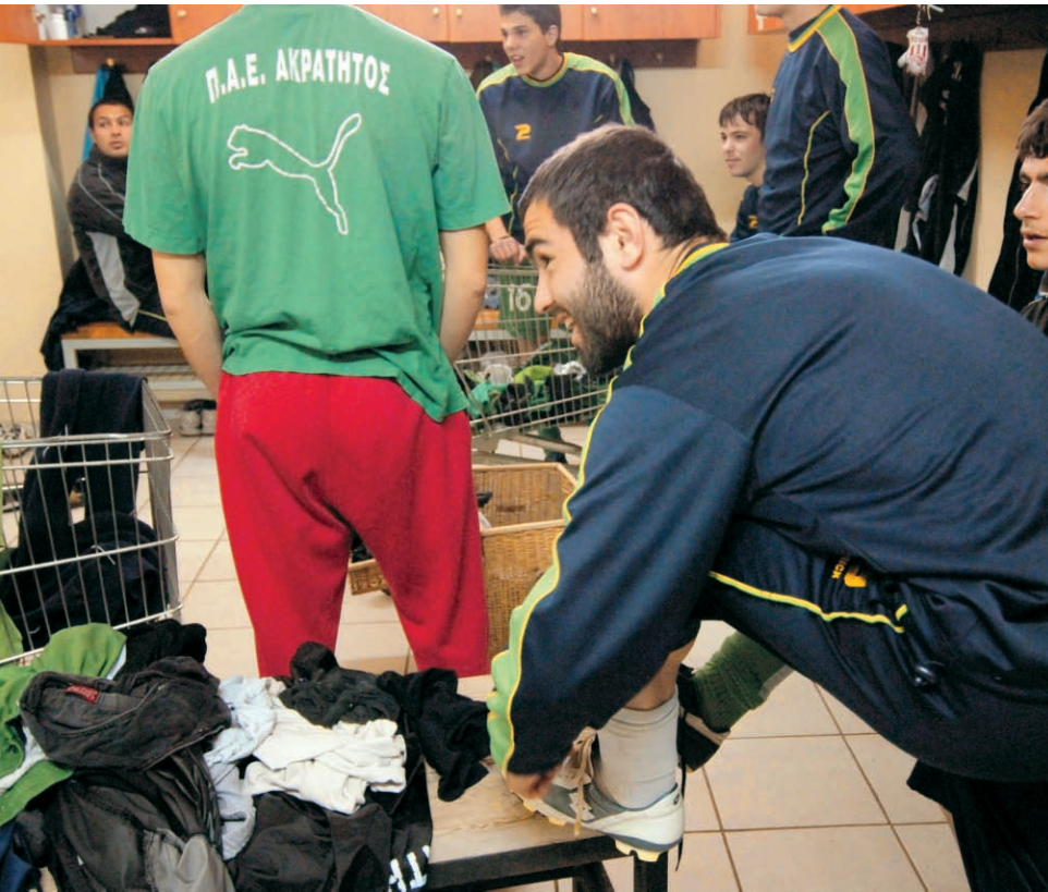
Όταν έσκασε η «φούσκα», ο Ακράτητος καταράκλισε ξανά στην Δ' Εθνική.