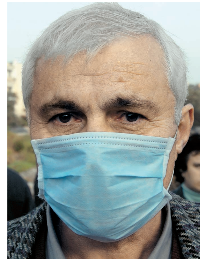
Όταν φυσούν νοτιοδυτικοί άνεμοι, στα Ανω Λιόσια πλανιέται η μυρωδιά της αποσύνθεσης από τη χωματερή.