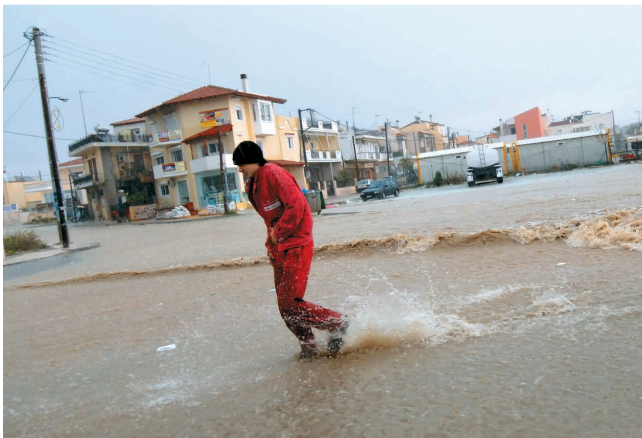
Παρά τα εκατομμύρια που μπήκαν στα ταμεία του δήμου, έργα υποδομής δεν υπάρχουν και οι δρόμοι πλημμυρίζουν με την πρώτη βροχή.

Οι υπόλοιποι αναγκάστηκαν να παραλάβουν τα σπίτια τους μιστελειωμένα. Αρκετοί με κατασκευασμένο μόνο το υπόγειο, άλλοι στο σκελετό, άλλοι με ολοκληρωμένη τοιχοποιία και άλλοι στα επιχρίσματα. Η κοινοπραξία τα μάζεψε και έφυγε στα τέλη του 2004. Οι περισσότεροι δικαιούχοι δεν έχουν καταφέρει ακόμη να ολοκληρώσουν τα σπίτια τους. Αρκετοί απ' αυτούς αναγκάστηκαν να πάρουν νέα δάνεια και ήδη κάποια σπίτια έχουν κατασχεθεί από τις τράπεζες. Δυστυχώς, μοναδική ενθαρρυντική εικόνα, τα σπίτια και τα καταστήματα που επισκεύασαν από μόνοι τους κάποιοι δημότες, που ξέφυγαν από τις δαγκάνες της δημοτικής αρχής και αξιοποίησαν συνειστά τα χρήματα της κρατικής βοήθειας. ▶