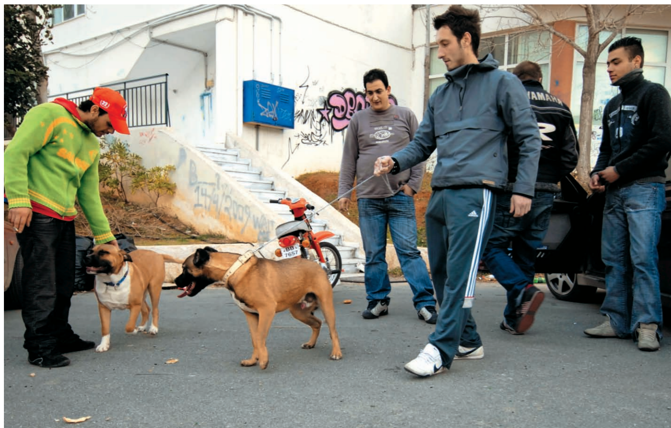
Η αίσθηση του ανεργάστου διαποτίζει και τις ενασχολήσεις της νεολαίας.

εξολοκλήρου από την Ε.Ε. και το Πρόγραμμα Δημοσίων Επενδύσεων.