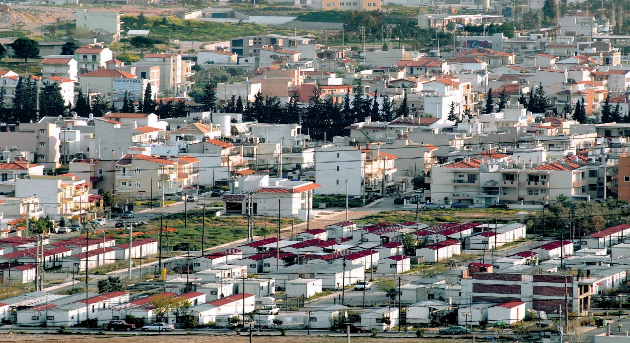
Η περιοχή των Ανω Λιοσίων από ψηλά: τα κοντέινερ ζουν και βασιλεύουν, στεγάζοντας ακόμη τους σεισμοπαθείς του '99.