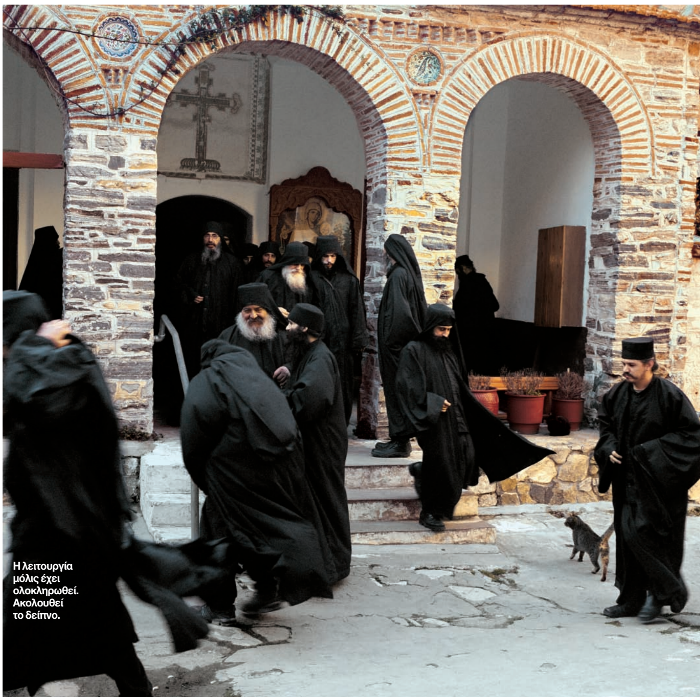
Η λειτουργία μόλις έχει ολοκληρωθεί. Ακολουθεί το δείπνο.