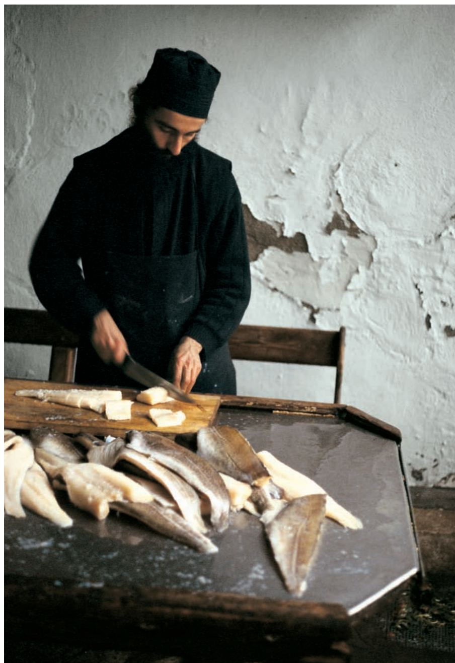
Παρά τον οικονομικό αποκλεισμό και τις δυσκολίες στην τροφοδοσία, «ο άρτος ο επιούσιος» εξασφαλίζεται.

Μοναχοί από τα φτωχά λαϊκά στρώματα. Πρώην αγρότες, μεροκαματιάρηδες, πρώην μετανάστες. Το μοναστήρι είναι το πιο φτωχό του Αγίου Όρους. Σε άλλες μονές, συναντάει κανείς μοναχούς, που ως κοσμικοί ήταν διανοούμενοι, καθηγητές Πανεπιστημίου, στελέχη τραπεζών, μόδιστροι και ανάμεσα στους προσκυνητές πλήθος επωνύμων και προβεβλημένων.