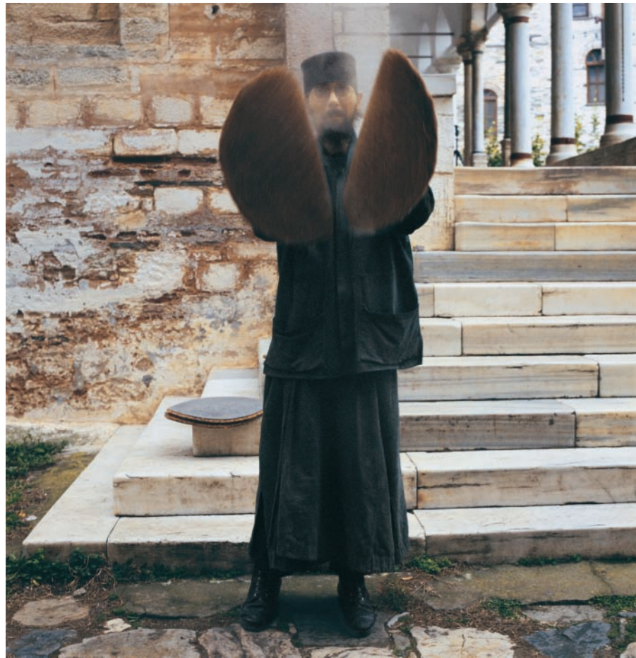
Νεαροί δόκιμοι ιερομόναχοι σε ώρα εργασίας.