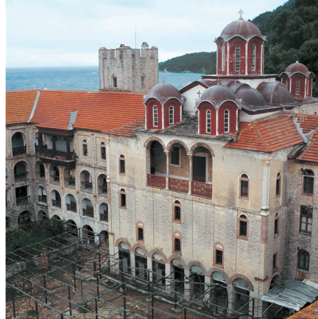
Η Ιερά Επιστοασία ισχυρίζεται πως «η Μονή δεν δέχεται επισκέπτες», ενώ στην πραγματικότητα έχει τη δυνατότητα να φιλοξενεί σχεδόν 400 προσκυνητές.

Εδώ, στην Εσφιγμένου, η ατμόσφαιρα είναι γαλήνια, οι ματιές καθαρές. Δεν κυριαρχεί η επιτήδεση. Ο καντηλανάφτης κατεβάζει με τροχαλίες τα καντήλια και τα κε-